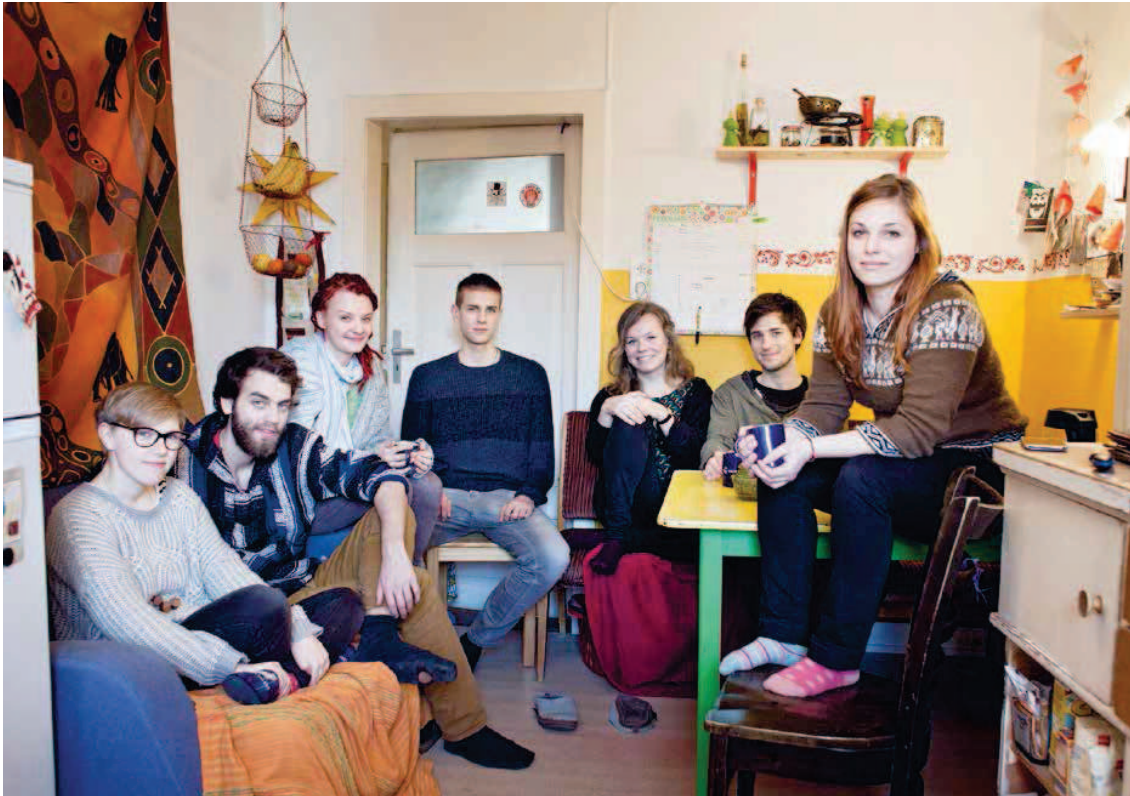
Eine WG mit drei Stockwerken: Studenten des Collegium Academicum

HAUSBESUCH Sie leben zu elft in einem Haus in Heidelberg – und finden die WG noch lange nicht groß genug