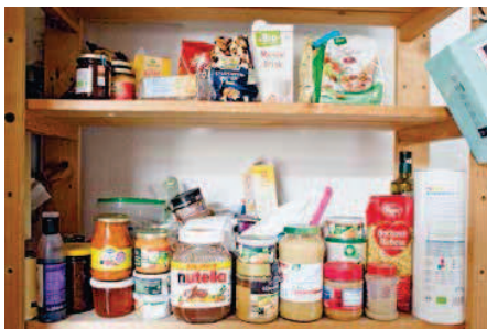
Stillleben mit Vorrat